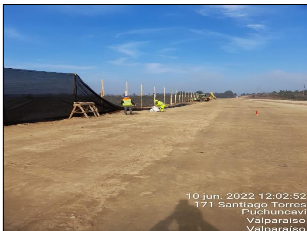
Figura 03: Postura de malla raschel en Sector 2 cercanos al punto 15 y 18 del Humedal Quirilluca.