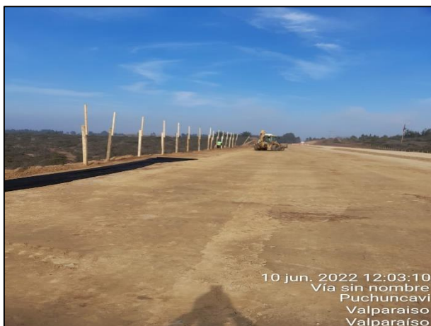
Figura 04: Postura de malla raschel en Sector 2 cercanos al punto 15 y 18 del Humedal Quirilluca.