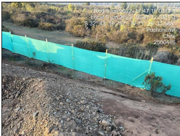
Figura 06: Postura de malla raschel en Sector 2 cercanos al punto 15 y 18 del Humedal Quirilluca.