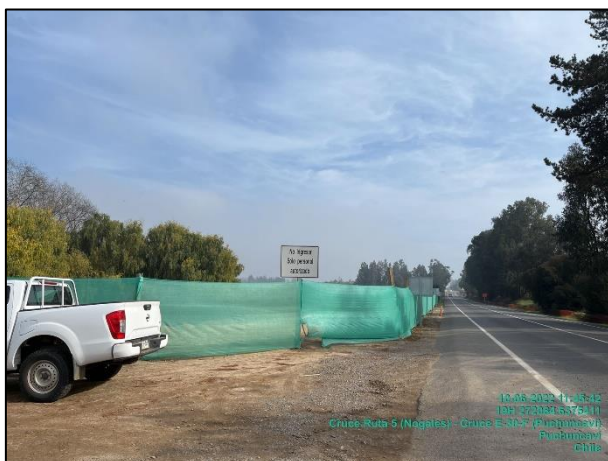
Figura 08: Medida de mitigación de malla raschel en Sector 1 comprendido entre el dm 25.500 al 25.260 margen izquierdo.