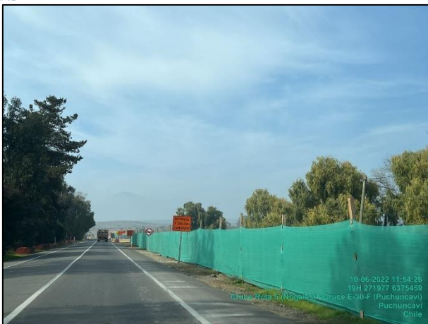
Figura 12: Medida de mitigación de malla raschel en Sector 1 comprendido entre el dm 25.500 al 25.260 margen izquierdo.