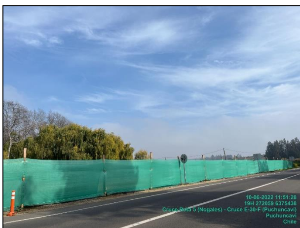
Figura 11: Medida de mitigación de malla raschel en Sector 1 comprendido entre el dm 25.500 al 25.260 margen izquierdo.