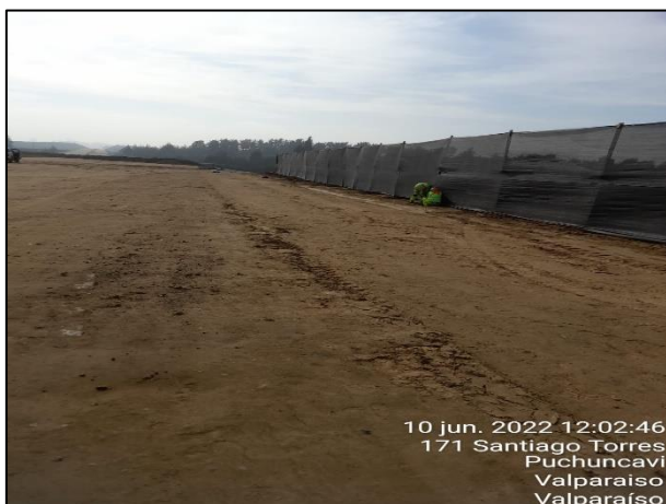
Figura 05: Postura de malla raschel en Sector 2 cercanos al punto 15 y 18 del Humedal Quirilluca.