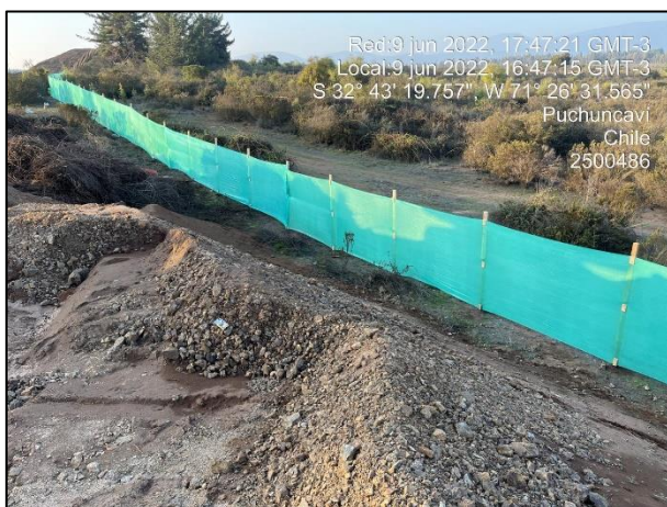
Figura 07: Postura de malla raschel en Sector 2 cercanos al punto 15 y 18 del Humedal Quirilluca.