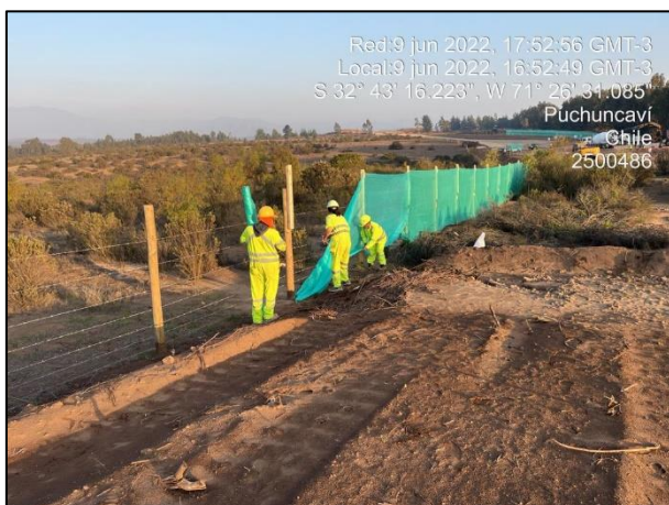
Figura 01: Postura de malla raschel en Sector 2 cercanos al punto 15 y 18 del Humedal Quirilluca.

Seguimiento fotográfico de la implementación de medidas de mitigación ambiental referente al componente aire durante el desarrollo de las actividades constructivas.