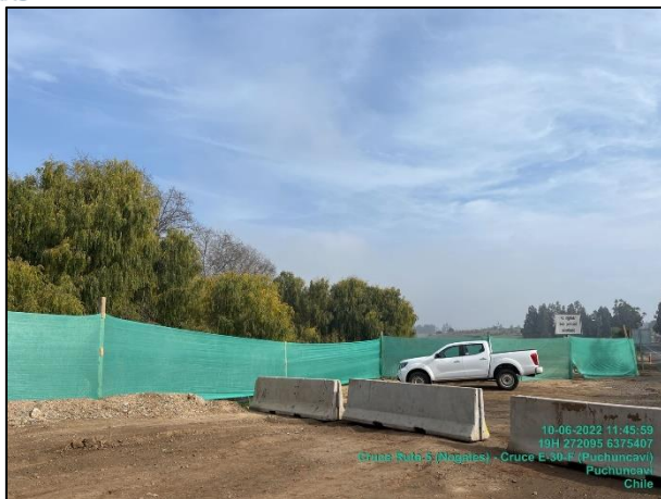
Figura 09: Medida de mitigación de malla raschel en Sector 1 comprendido entre el dm 25.500 al 25.260 margen izquierdo.