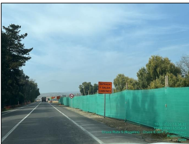
Figura 13: Medida de mitigación de malla raschel en Sector 1 comprendido entre el dm 25.500 al 25.260 margen izquierdo.