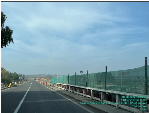
Figura 14: Medida de mitigación de malla raschel en Sector 1 comprendido entre el dm 25.500 al 25.260 margen izquierdo.