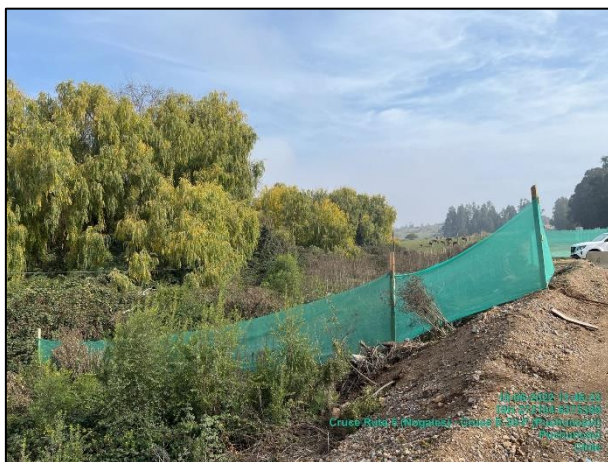
Figura 10: Medida de mitigación de malla raschel en Sector 1 aledaño a obras del Puente Puchuncaví